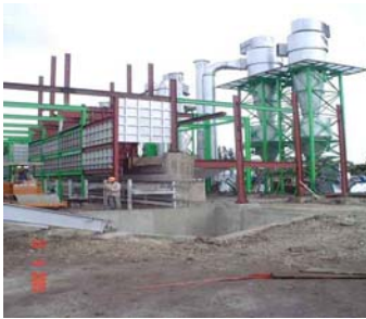
Construcción Planta Sinterizadora al 15 de Abril de 2005

programa de inversiones. Al cierre del primer trimestre la deuda total de la empresa asciende a $203.3 mdp y la deuda neta es de $74.5 mdp.